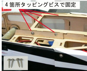
4箇所タッピングビスで固定