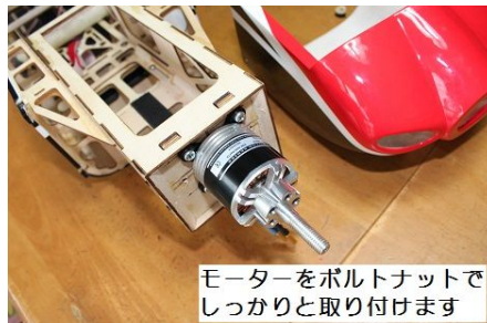
モーターをボルトナットでしっかりと取り付けます