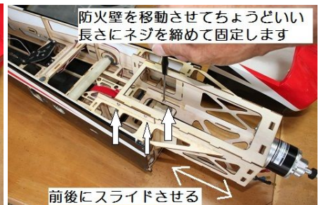
防火壁を移動させてちょうどいい長さにネジを締めて固定します