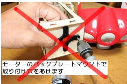
モーターのバックプレートマウントで取り付け穴をあけます