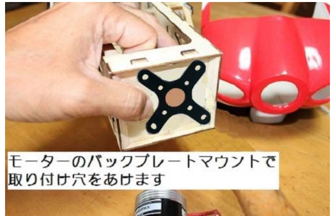
モーターのバックプレートマウントで取り付け穴をあけます

防火壁の罫書き線は、あくまで参考です。実際にモーターの位置は、キャンピーハッチとカウリングと一緒に仮組みしてカウリングの穴に合わせてモーターの位置決めをして下さい。