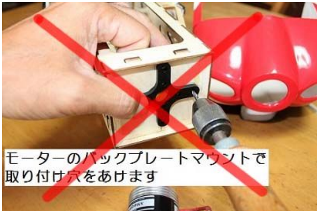
モーターのバックプレートマウントで取り付け穴をあけます