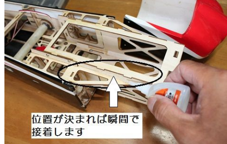
位置が決まれば瞬間で接着します

カウリングを仮合わせし、防火壁ブロックを前後にスライドして長さを調整して、ネジ止めと瞬間で固定します。